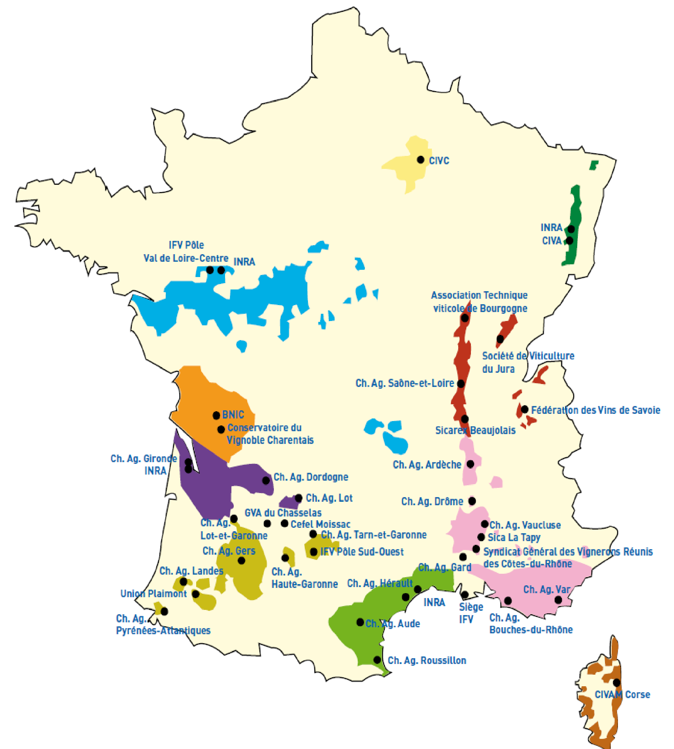
Figure 1 : Carte des partenaires de la Sélection Vigne Française