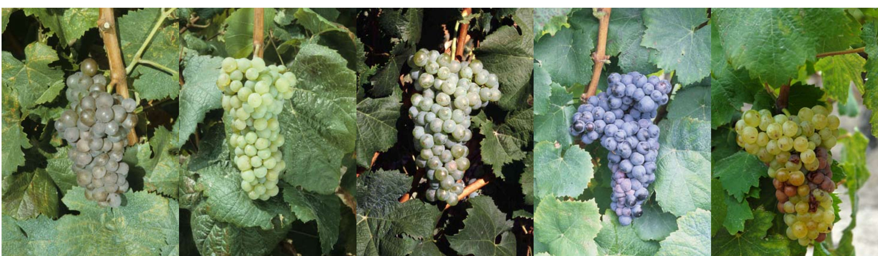
Trousseau gris G Romorantin B Claverie B Prunelard N Saint-Côme B

Face à l'érosion variétale mesurée depuis 1958, les partenaires de la sélection viticole française (CTNSP) ont réagi de manière cohérente et structurée. A ce jour, il existe 120 conservatoires (figure 2) implantés dans les régions viticoles, maintenant la diversité des principaux cépages français, mais aussi de certaines variétés secondaires. Cependant, même si un travail considérable a déjà été réalisé, de nombreux cépages restent encore sans conservatoires ni clones agréés. Des actions urgentes de prospection et de sauvegarde doivent donc être poursuivies afin de conserver dans les meilleures conditions possibles le patrimoine viticole français. La valorisation du matériel végétal reste un des atouts majeurs d'une viticulture dynamique et ouverte à l'innovation. C'est notamment grâce à ces initiatives locales que les viticulteurs peuvent mettre en valeur la spécificité de leurs cépages et de leurs vins, et s'ouvrir des marchés.